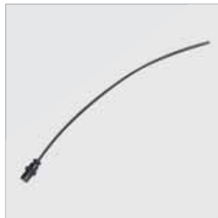
Verlängerung TEC 1,8 m No. 1500000010