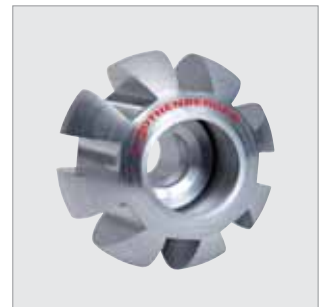
Führungskugel für alle Pipe Module No. 74629