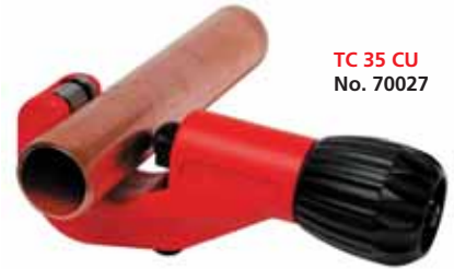
TC 35 CU No. 70027