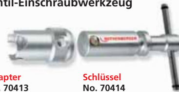
Adapter No. 70413