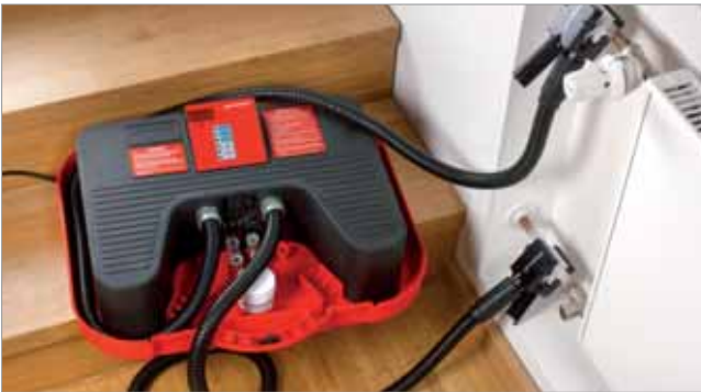
ROFROST® ECO in der Anwendung