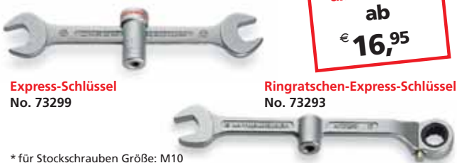
Express-Schlüssel No. 73299