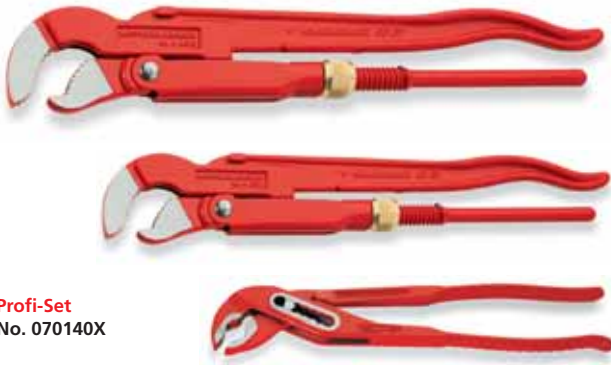
Profi-Set No. 070140X

Praxisgerechte Zusammenstellung von Rohrzangen und Rohrabschneidern