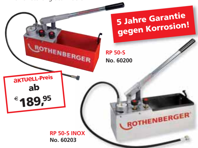
RP 50-S No. 60200