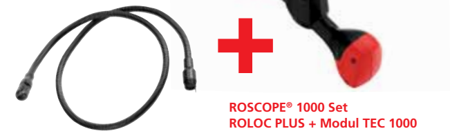
ROSCOPE® 1000 Set ROLOC PLUS + Modul TEC 1000 No. 1000000065