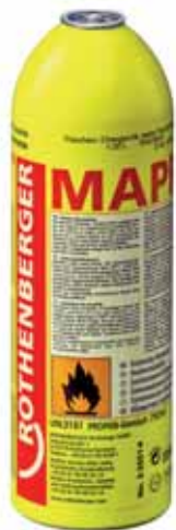
MAPP® Gas No. 35551-A