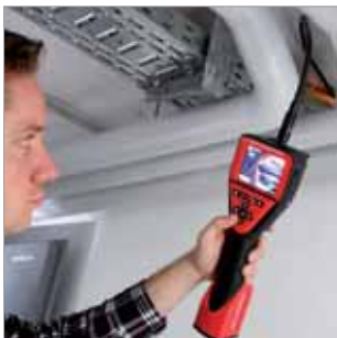
ROSCOPE® 1000 Set + Modul TEC 1000 No. 69600