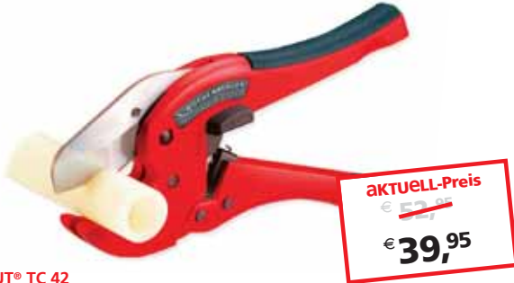
ROCUT® TC 42 bis Ø 42 mm No. 52000

Für präzise Schnitte in PP-, PE-, PEX-, PB- und PVDF-Rohren