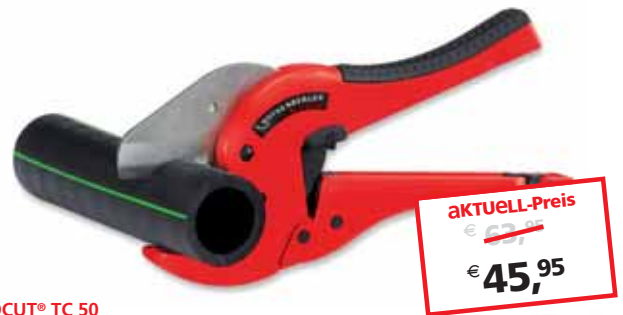
ROCUT® TC 50 bis Ø 50 mm No. 52010