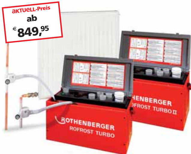
ROFROST TURBO 1.1/4" No. 62200