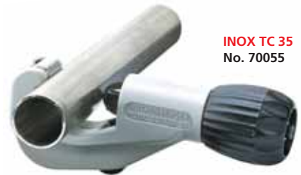
INOX TC 35 No. 70055