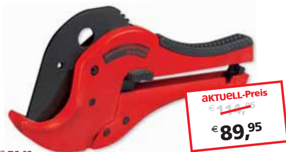
ROCUT® TC 63 bis Ø 63 mm No. 52030