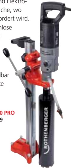
RODIACUT® 130 PRO No. 1000000089