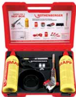
SUPER FIRE 3 HOT BOX No. 35490