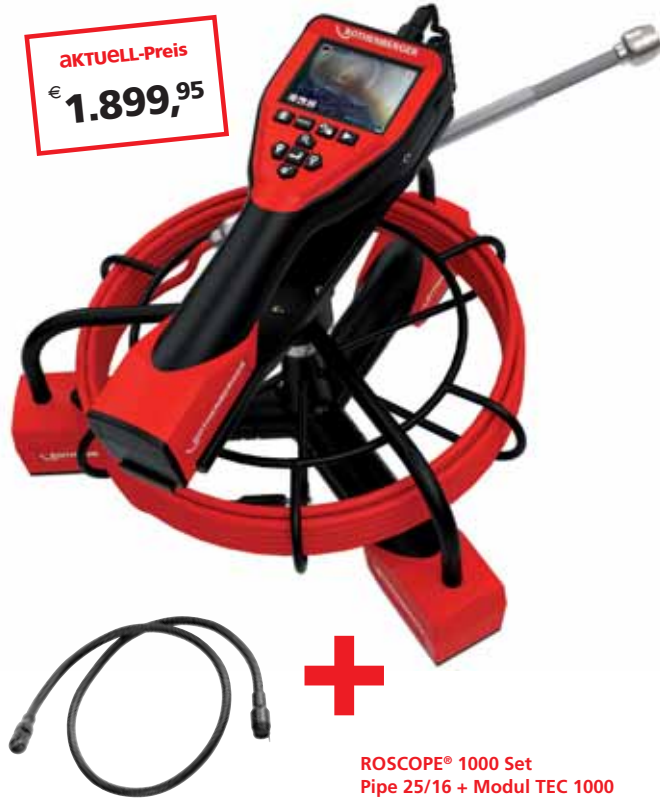
ROSCOPE® 1000 Set Pipe 25/16 + Modul TEC 1000 No. 1000000064