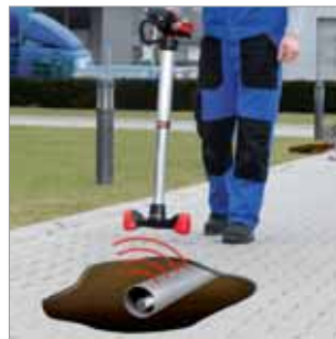
ROSCOPE® 1000 Set ROLOC PLUS + Modul TEC 1000 No. 1000000065