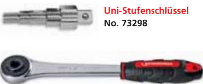
Uni-Stufenschlüssel No. 73298